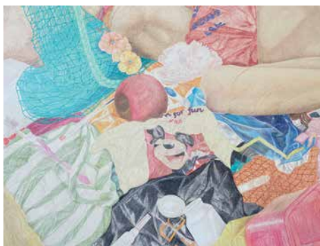
Émilie Magnan, « Aurore » (détail), 2022. Crayon de couleur sur papier tendu sur châssis, 105 x 200 cm