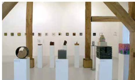
20 ans du CACLB, vue d'exposition

En juin 2004, à l'occasion de ses 20 ans, le Centre d'Art Contemporain du Luxembourg Belge avait convié les artistes qui avaient participé à ses activités, à créer une œuvre originale de format défini de 20 cm de côté. Près d'une centaine d'œuvres ont ainsi été exposées en juin 2004 à la Grange du Faing à Jamoigne. De nombreux artistes ont ensuite souhaité offrir leur œuvre au CACLB.