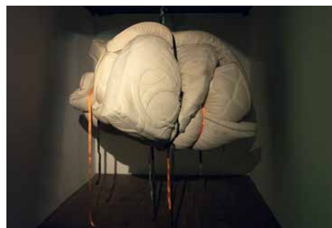
Arthur Delhaye, « Sommeil lourd ». Matelas, sangles, corde, enceintes, smartphone et matériaux divers, dimensions variables