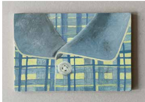
Myriam Hornard, « Gone child » Huile sur bois, 14 x 22 cm