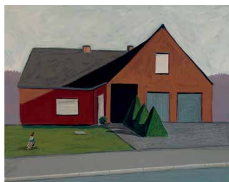
Bruno Van de Graaf, « Au milieu de nulle part », 2024. Acrylique sur carton