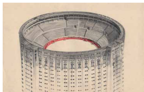
Amélie Scotta, « Built 8 » (détail), 2020. Dessin au graphite et crayon de couleur sur papier journal, 36 x 28 cm