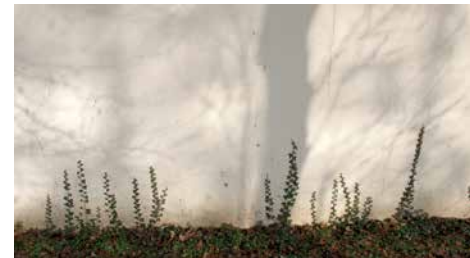
Photographie de recherche, Nature vivante - Nathalie Maufroy

Intitulée « Nature vivante », cette création in situ explore la relation entre une nature et une architecture, offrant aux visiteurs une expérience sensorielle issue de la rencontre entre l'artiste et la nature luxuriante du site du CA CLB à Montauban. Inspirée également par l'iconographie et la photographie de lieux anciennement habités, parfois soudainement abandonnés des hommes, où la nature a repris ses droits. L'œuvre envahit l'espace muséal aseptisé ; elle mêle végétal et éléments architecturaux,