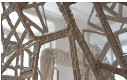
Stéphanie Jacques, « Ce qu'il en reste XII » (détail), 2022