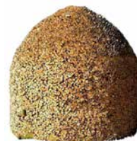
Ida W-M, projet d'installation

Dans ses derniers travaux, Amélie Scotta s'intéresse plus particulièrement à la ville en construction, en mutation permanente. Elle s'attarde sur des installations de chantier (bâches, échafaudages, excavations, etc.) qui constituent les traces d'une architecture en devenir. Ces structures de lignes et de drapés ne sont pas sans évoquer le squelette ou la peau et nous parlent de la ville comme d'un organisme vivant.