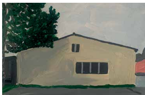
Bruno Vande Graaf, « Au milieu de nulle part » (détail), 2024. Acrylique sur carton