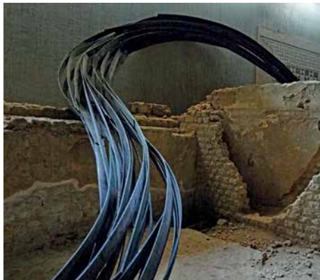
Rainer Gross, « Flux » (détail), 2014. Installation sculpturale dans les vestiges gallo-romains du musée Sainte-Croix à Poitiers

Nonobstant ces indications, je tiens à souligner que mes installations sont en premier lieu le fruit du plaisir de la création plastique, de construire et de « dessiner dans l'espace ». Ainsi, ce projet présente toutes les caractéristiques de mon approche sculpturale habituelle : l'installation est à la fois légère et imposante, aérienne et enracinée. Elle présente des processus